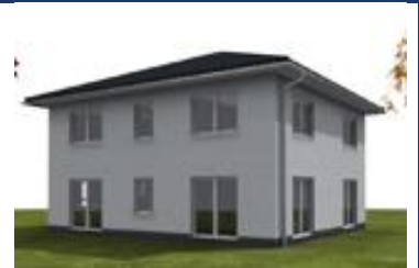
EFH im Stadthausstil, ca. 154 m 2 , Sole-Wasser-Wärmepumpe & Lüftung mit WRG, in 15838 Klausdorf