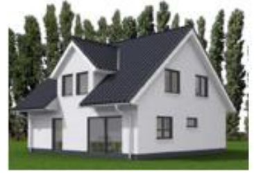
EFH 3-Giebelhaus im Klassikstil, ca. 135 m 2 , Luft-Wasser-Wärmepumpe & Lüftung mit WRG, in 15757 Halbe