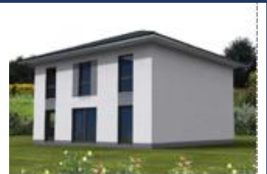
EFH im Stadthausstil, ca. 143 m 2 , Luft-Wasser-Wärmepumpe & Lüftung mit WRG, in 12526 Berlin-Bohnsdorf